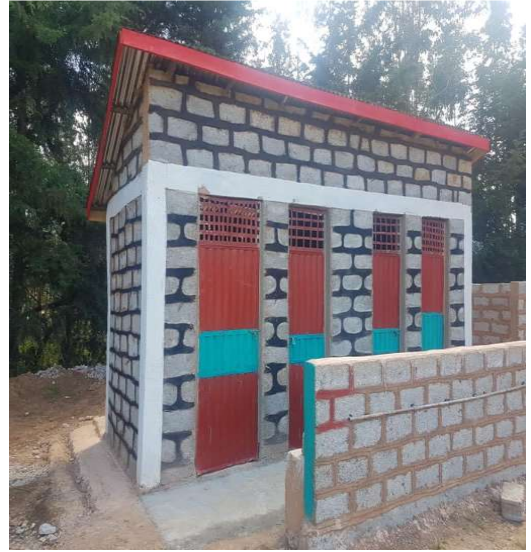
የተሻሻለ መጽዳጃ ቤት ግንባታ በጤና ኬላና በትምህርት ቤት / ደብብሕ ክልል/ኦሮሚያ ክልል/ በንቲ እ.