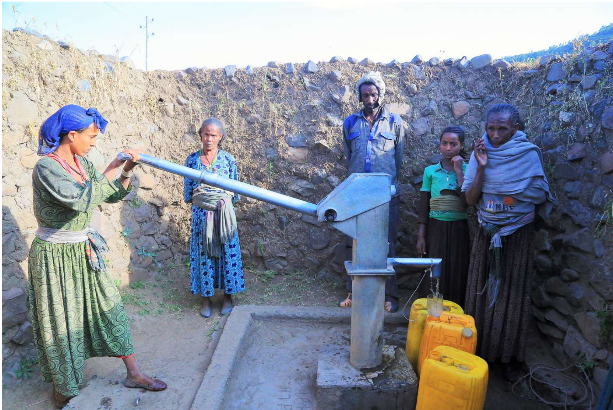
የማህበረሰብ የውሃ ጣቢያ፣ የእጅ ፓምፕ የተገጠመለት የእጅ ጉድጓድ/ትግራይ ክልል/መላኩ ተ.