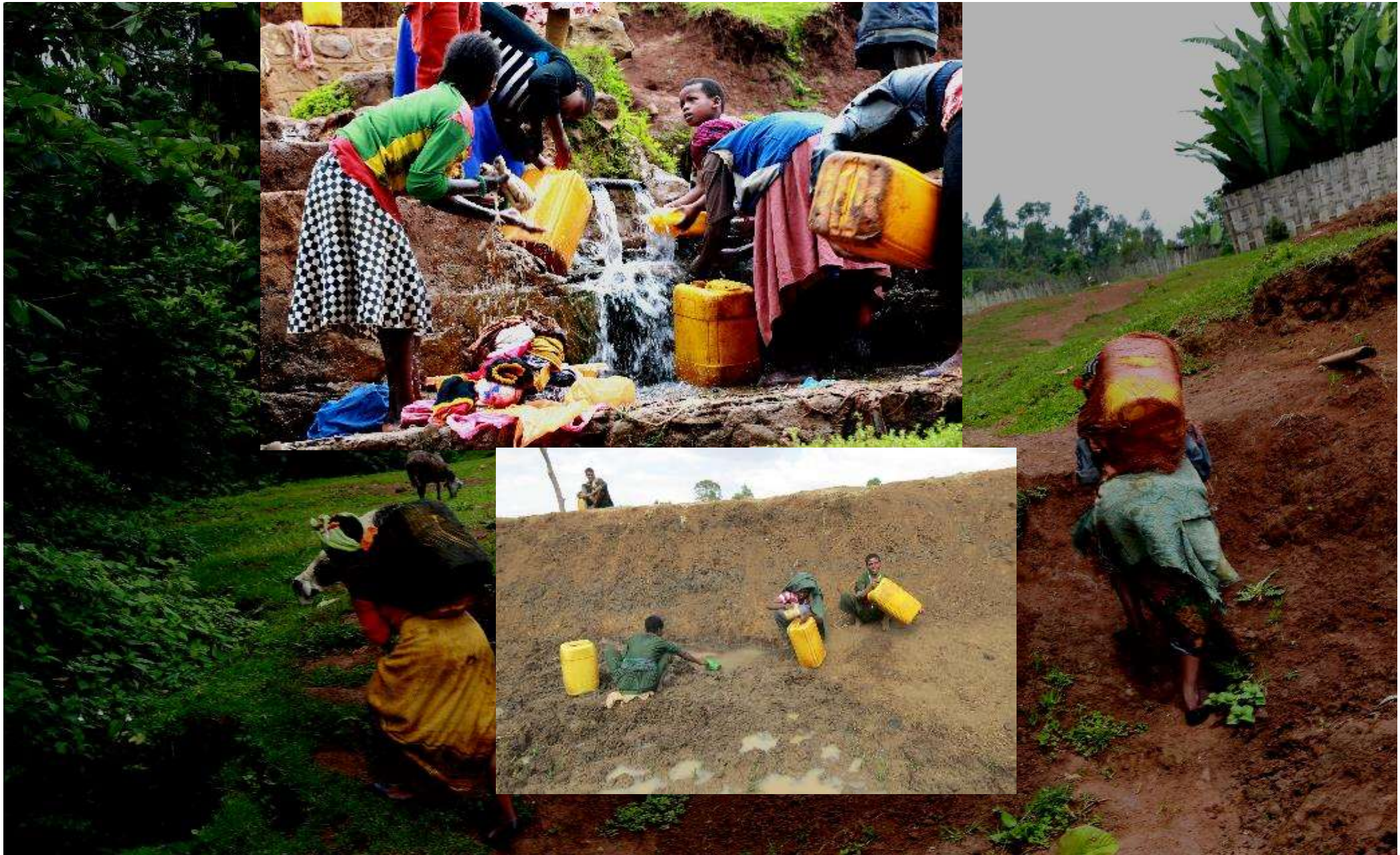
የኢትዮጵያ ሴቶች ውሃ ለመቅዳት ከሚያጋጥሟቸው ተግዳሮቶች መካከል በከፊል/ ደብዳቤ ክልል/ አማራ ክልል/መሳኩ ተ.